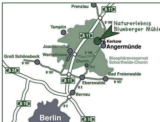
Anfahrtsskizze Blumberger Mühle

Anlage: Übersichtskarte Lage der FFH-Gebiete