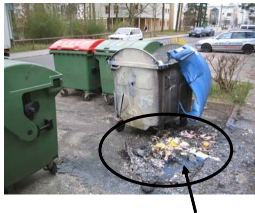
Das ist der Rest von einem kompletten Papier-Container aus Kunststoff!

Sollten Sie solche Handlungen beobachten, melden Sie sich bitte umgehend bei der Polizei oder beim Bodenschutzamt unter Tel.-Nr. 0 33 34 / 214 564.