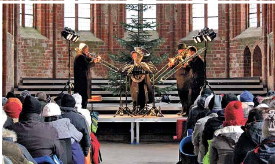
Posaunenquintett Berlin beim 6. Neujahrskonzert im Kloster

POSAUNENQUINTETT BERLIN BEGRÜSSTE NEUES JAHR