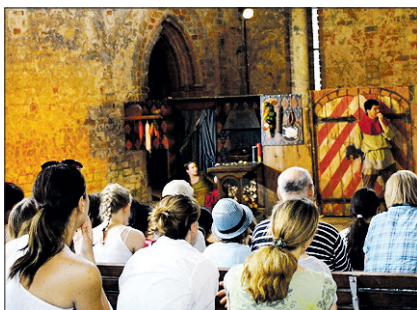
Theater Morgenstern im Hallenschiff der Klosterkirche Chorin

Einzelkarten (bis 2 Personen) 10 Euro, ab 3 Personen 9 Euro, ab 5 Personen 8 Euro