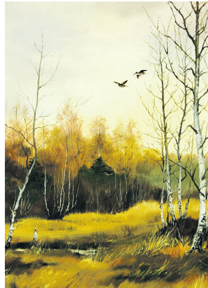
H.-H. Eisermann, „Schneppenstrich“, Öl 50x40 cm

Nächster Termin der offenen Ateliers im Landkreis Barnim: Sonntag, der 2. Dezember 2012