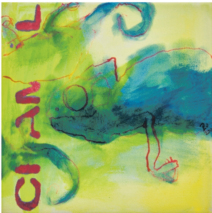
© Petra Lehnardt-Olm Urhebernr. 2211081 VG-Bild

a. d. Serie Reisebriefe: Morgenfrost 20 x 20 cm Mischtechnik auf Leinwand 2008