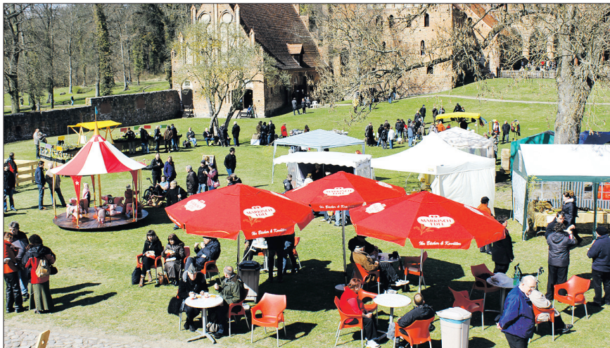
Ostertage im Kloster

Für Groß und Klein wurde Interessantes geboten