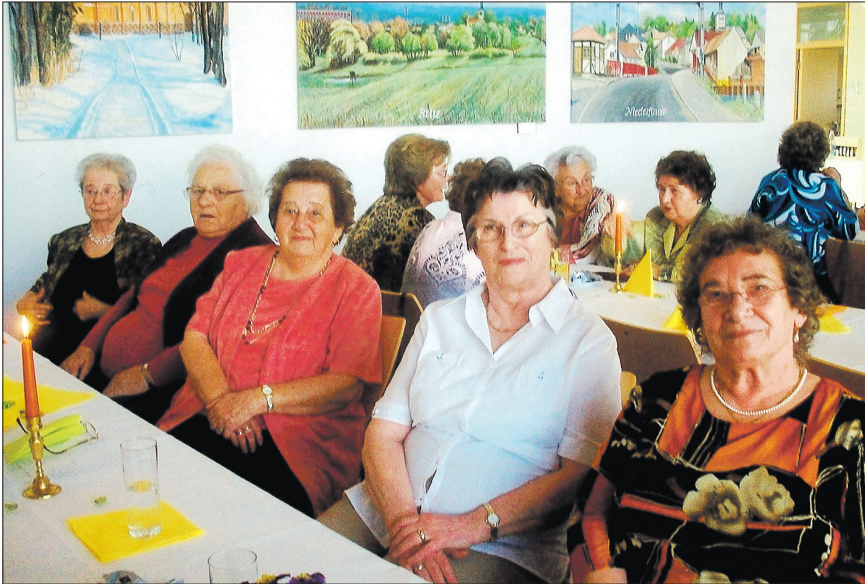
Frühlingsfest der Senioren in Britz

Gute Unterhaltung und viel Freude im Rathaus