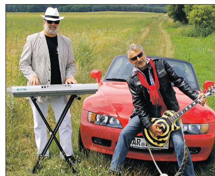
Sonny and Friends aus Berlin

Am 6. Mai wird in der Hermann-Seidel-Straße ein Stolperstein gelegt. Der Festakt beginnt um 15.00 Uhr und wird von der Familie Lesser aus Berlin initiiert zum Gedenken der jüdischen Familie in Oderberg.