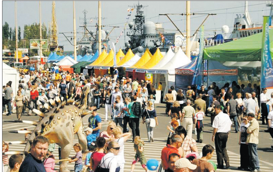
Picknick an der Oder 2011

Plattform zur Präsentation und Kontaktbörse