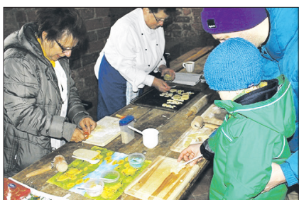
Osterbacken in der Klosterküche