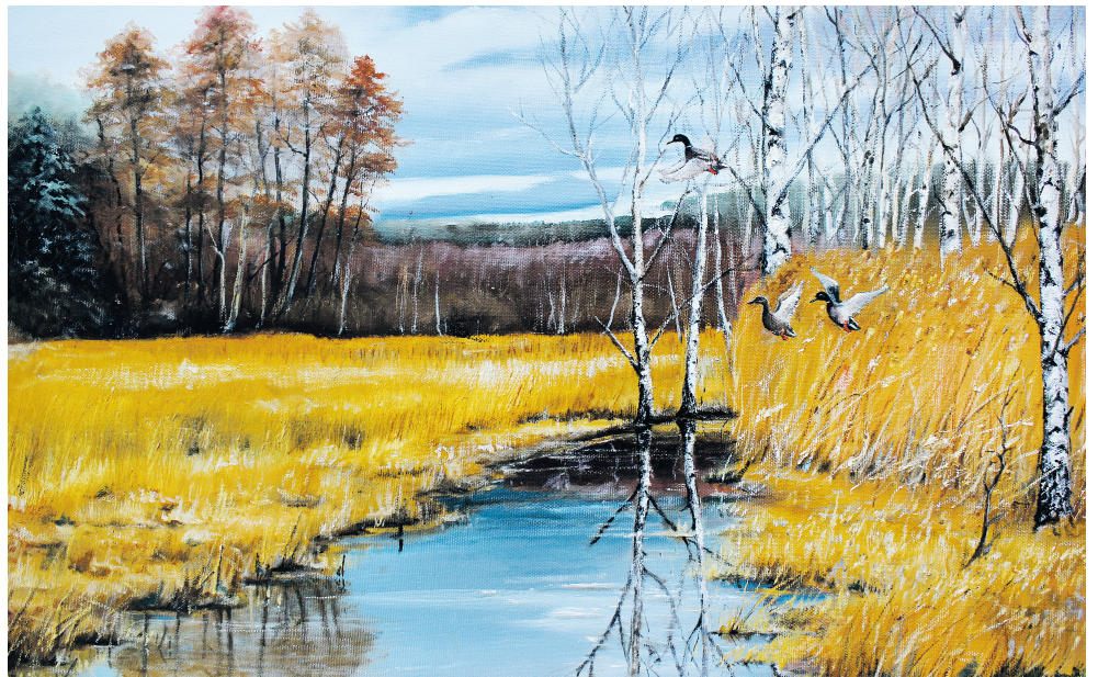
H.-H. Eisermann, „Kalten Wasser Britz“, Öl