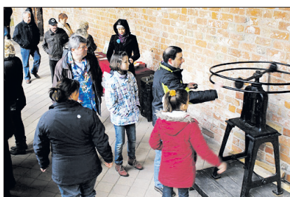
Prägung des Sonderbarni