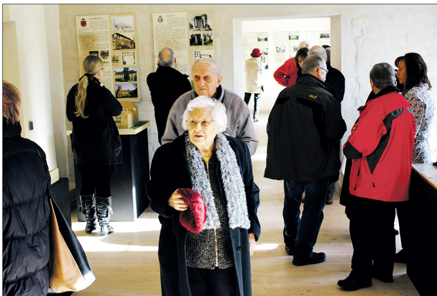
Vernissage am 3. März im historischen Abthaus