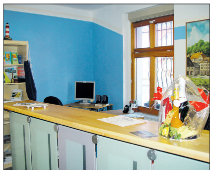
Der Servicebereich ganz neu

An diesem Tag hatten wir eine Frau in unserer Mitte von der Johanniter Unfallhilfe, die mit uns eine Ersthelfer Ausbildung durchführte. Viele von den Teilnehmern haben die Ausbildung vor vielen Jahren gemacht zur Führerscheinprüfung. Da wir fast alle auf die 60 zu gehen und diese wichtige Ausbildung Jahrzehnte her ist, jetzt wissen wir wieder, wie