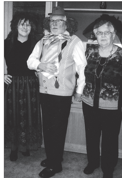
Fasching in Britz

Am 14. Februar feierten die Chormitglieder im Clubraum Fasching. Schöne Kostüme konnten bewundert werden. Es