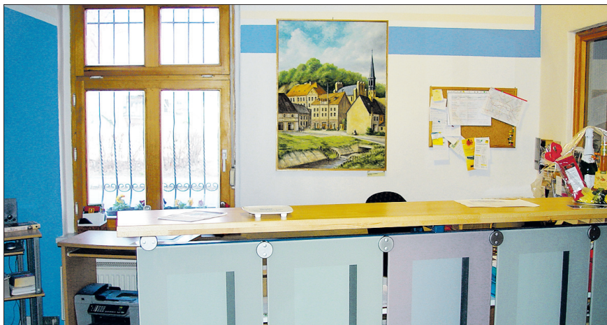
Viele ehrenamtliche Helfer unterstützten die Neugestaltung

die stabile Seitenlage am Verunglückten gemacht wird. Wir haben lebensrettende Handgriffe gelernt. Die Herz-Lungen-Wiederbelebung wiederholt und wie man Wundversorgung macht und Verbände anlegt. In den vielen Jahren hat sich noch einiges verändert. Jeder von uns hofft, natürlich nicht in so eine Notsituation zu kommen, aber falls doch, sind wir jetzt gewappnet. Vielen herzlichen Dank noch an unsere junge Dozentin, die das ganz toll vermittelt hat.